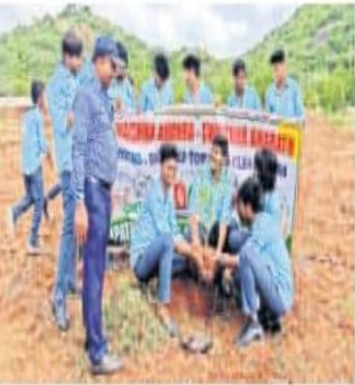
కళాశాలలో మొక్కలు నాటుతున్న విద్యార్థులు